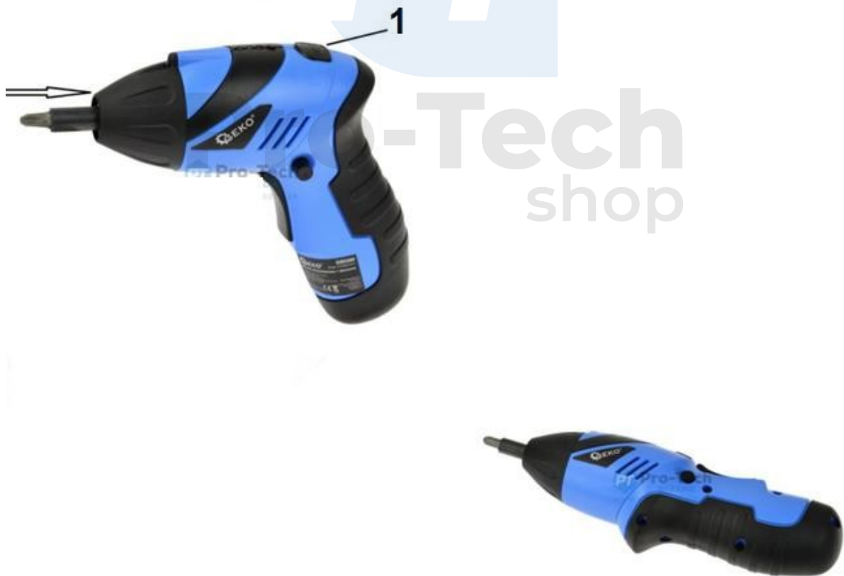
1. Csavarhúzó igazító gomb

az óramutató járásával megegyező irányban. Most már használhatja a csavarhúzót egyenes vonalzóként.